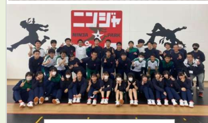
2組 ニンジャパーク古河