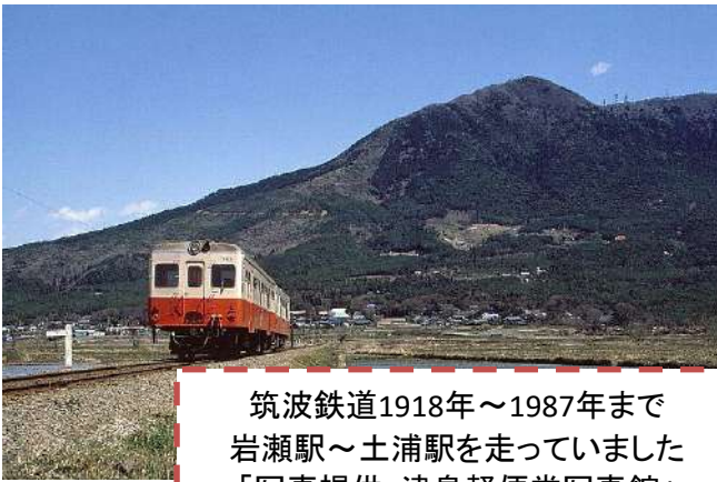
筑波鉄道1918年～1987年まで岩瀬駅～土浦駅を走っていた

道中には様々な美味しいお店があるので、運動を楽しみながら、おいしい物を食べることができます。コースは40kmから180kmまで様々なコースがあるので自分の体力に合わせて挑戦してみたいかがでしょうか？