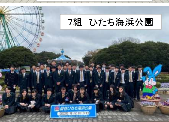
7組 ひたち海浜公園