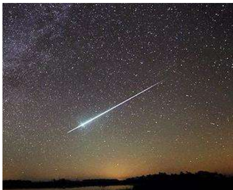
こぐま座流星群へ https://image.news.livedoor.com

いづくに出現するかは分かりませんので、なるべく空の広い範囲を見渡すようにし、レジャーシートを敷いて地面に寝転ぶと、楽に観察できます。皆さんもやってみてはいかがでしょうか？