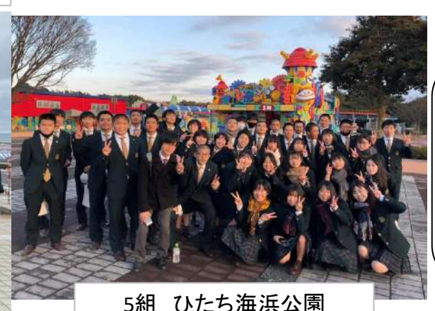
5組 ひたち海浜公園