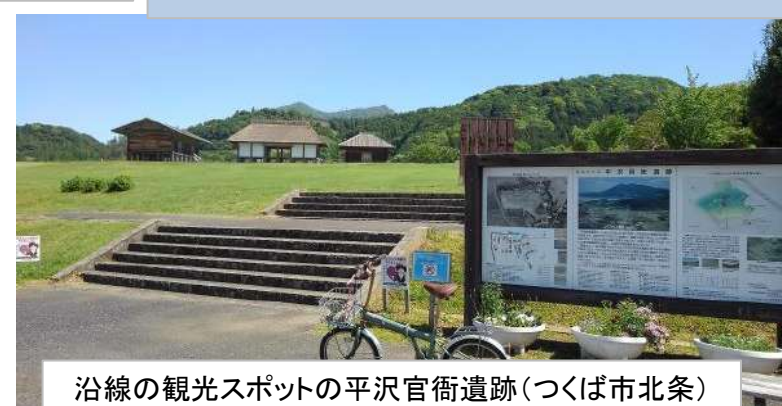
沿線の観光スポットの平沢官衙遺跡(つくば市北条)