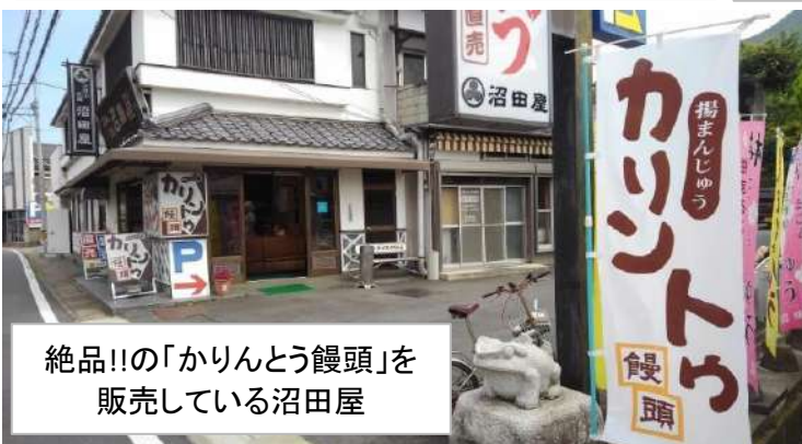
絶品!!の「かりんとう饅頭」を販売している沼田屋

旧筑波駅の近くには「松屋製麺所」やかりんとう饅頭の「沼田屋」などの飲食店があります。とっても美味しいので、是非お店に立ち寄ってみてください。