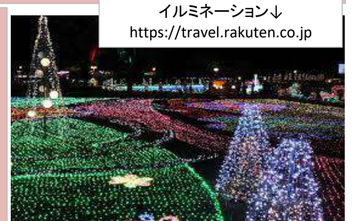
イルミネーションへ https://travel.rakuten.co.jp

始まりは1522年の日本、周防の国(現在の山口県)にやってきたフランシスコ・ザビエルがミサを行ったことが始まりで、当時の日本ではクリスマス「ナタラ」と言っていました。1560年頃になると京都にキリシタンが100名以上集まり、盛大にクリスマスを行っていました。