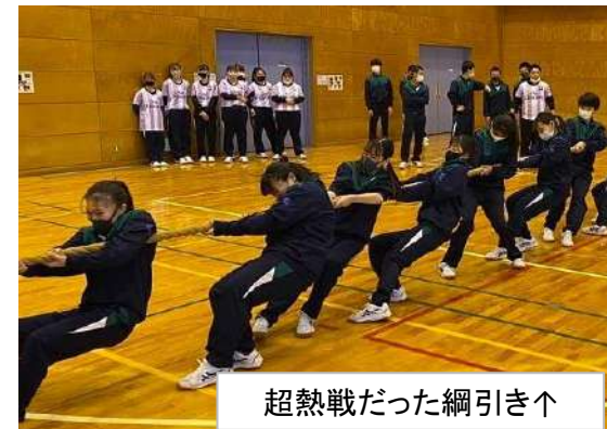
超熱戦だった綱引き