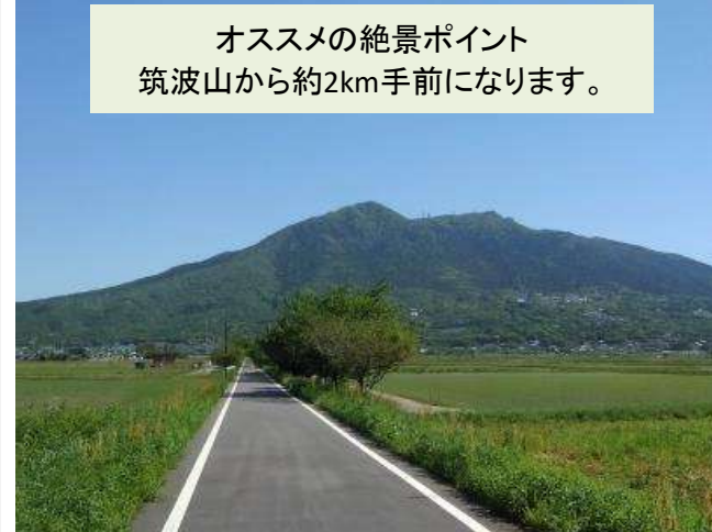
オススメの絶景ポイント 筑波山から約2km手前になります。

東京から1時間以内でアクセスできる土浦駅に、サイクリングを楽しむための拠点として2018年3月に「PLAYatレ TSUCHIURA(プレイアトレ土浦)」がオープンしました。その中の星野リゾートホテルでは、部屋に自転車を持ち込むことができ、サイクリストに優しいホテルを運営しています。レンタサイクルは、沿線9市町で行っています。電車などで、手ぶらで訪れ、りんりんロードの沿線11カ所の施設などでも自転車の貸出・返却が可能だそうです。こうして、つくば霞ヶ浦りんりんロードを、茨城県のサイクリング拠点として身近なものにしています。