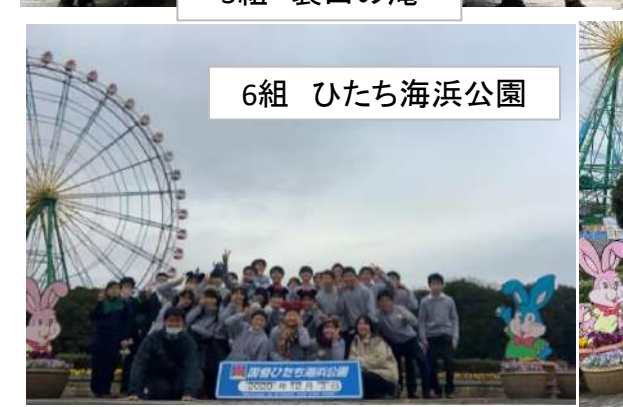
6組 ひたち海浜公園