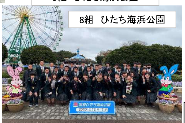
8組 ひたち海浜公園