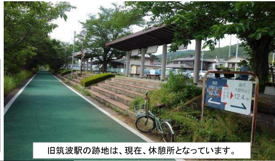
旧筑波駅の跡地は、現在、休憩所となっています。

つくば霞ヶ浦りんりんロードについて りんりんロードが整備される前は、筑波鉄道が岩瀬駅～土浦駅まで走っていました。筑波鉄道が1987年に廃線になると自転車道が整備され、2016年につくば霞ヶ浦りんりんロードが開通しました。