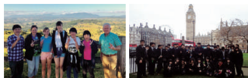
英検®は、公益財団法人 日本英語検定協会の登録商標です。